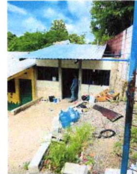
Foto 2: INSTALACIÓN DE TECHO CON ESTRUCTURA METALICA Y LAMINA TROQUELADA EN COCINA