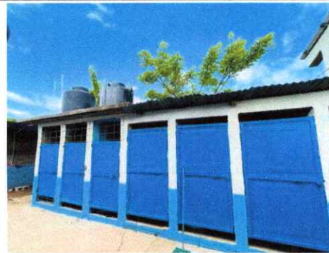
Foto 4: INSTALACIÓN DE TUBERÍA PARA DEPÓSITO DE AGUADE Y MINGITORIO CON SUS ACCESORIOS