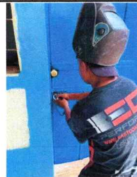
Foto 6: REPARACIÓN, PINTURA GENERAL E INSTALACIÓN DE CHAPA EN PUERTAS METALICAS

Observación: Si es necesario se pueden agregar hojas adicionales y actualizar el número de hojas.