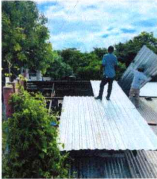
Foto1: INSTALACIÓN DE TECHO CON ESTRUCTURA METALICA Y LAMINA TROQUELADA EN COCINA