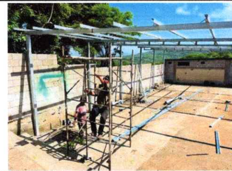
Foto 12: INSTALACIÓN DE TECHO CON ESTRUCTURA METÁLICA Y LAMINA ACANALADA

Observación: Si es necesario se pueden agregar hojas adicionales y actualizar el número de hojas.