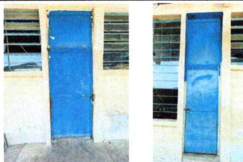
Foto 6: REPARACIÓN, PINTURA GENERAL E INSTALACIÓN DE CHAPA EN PUERTAS METÁLICAS

Observación: Si es necesario se pueden agregar hojas adicionales y actualizar el número de hojas.