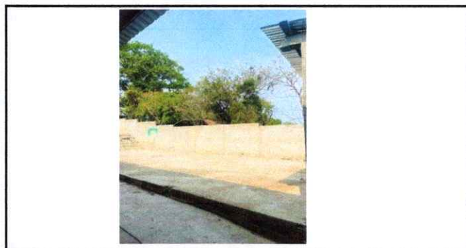
Foto 12: INSTALACIÓN DE TECHO CON ESTRUCTURA METÁLICA Y LAMINA ACANALADA

Observación: Si es necesario se pueden agregar hojas adicionales y actualizar el número de hojas.