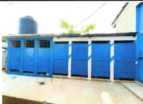
Foto 4: INSTALACIÓN DE TUBERÍA PARA DEPÓSITO DE AGUADE Y MINGITORIO CON SUS ACCESORIOS