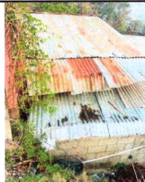
Foto 2: INSTALACIÓN DE TECHO CON ESTRUCTURA METALICA Y LAMINA TROQUELADA EN COCINA