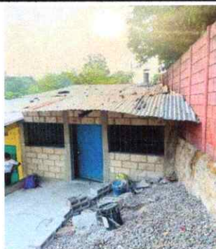
Foto 1: INSTALACIÓN DE TECHO CON ESTRUCTURA METALICA Y LAMINA TROQUELADA EN COCINA