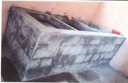
Foto 5: SUSTITUCIÓN Y FUNDICIÓN DE PILA DE 2 LAVADEROS DE CONCRETO ARMADO