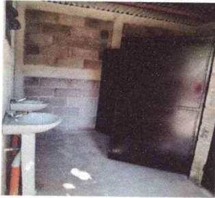
Foto 3: MEJORAMIENTO Y AMPLIACIÓN DE MÓDULO DE SERVICIOS SANITARIOS