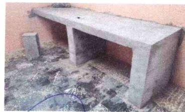
Foto: MEJORAMIENTO DE MESA DE TRABAJO EN COCINA

Observación: Si es necesario se pueden agregar hojas adicionales y actualizar el número de hojas.