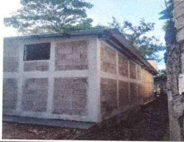
Foto1: INSTALACIÓN DE TECHO CON ESTRUCTURA METALICA Y LAMINA TROQUELADA