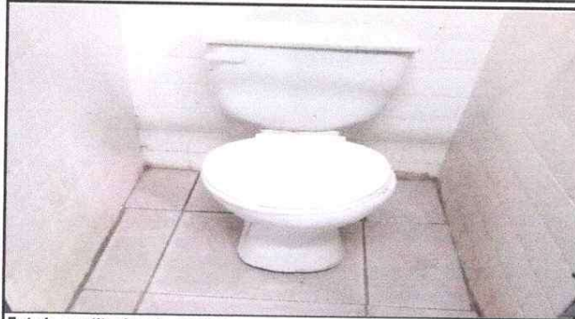
Foto1: sustitucion de sanitarios