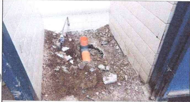
Foto1: Instalacion de servicios sanitarios