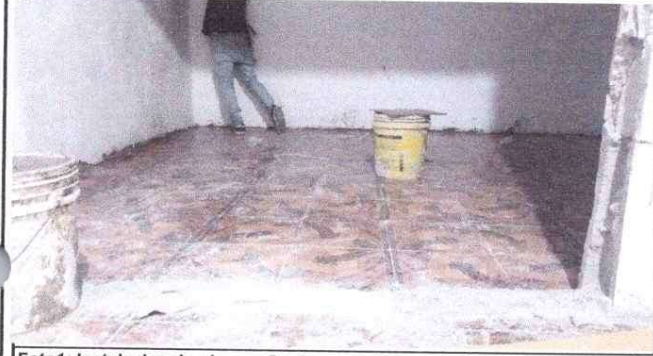
Foto1: Instalacion de piso en Cocina