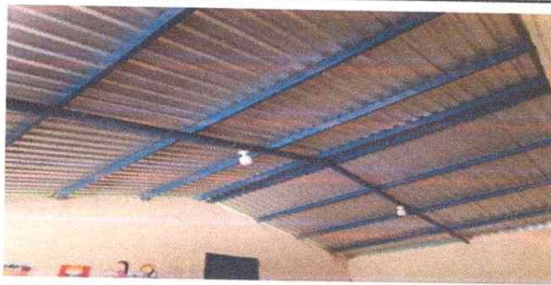
Foto 5: Instalación eléctrica: dos bombillas y tomacorrientes en aula