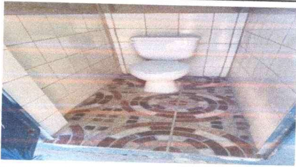
Foto1: Instalación de azulejo y piso en baños