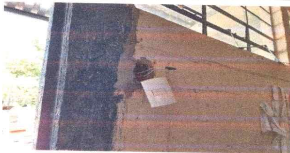
Foto 5: Instalación eléctrica: dos bombillas y tomacorrientes en aula