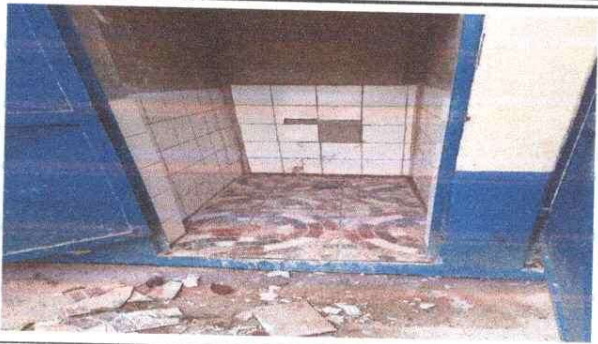
Foto1: Instalación de azulejo y piso en baños