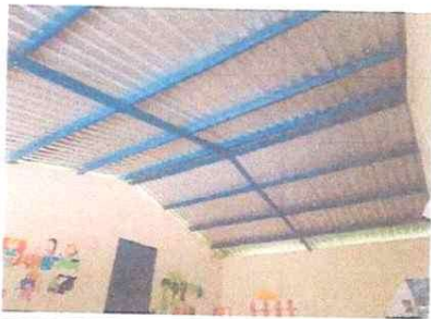
Foto 5: Instalación eléctrica: dos bombillas y tomacorrientes en aula