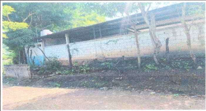
Foto1: Mejoramiento muro perimetral