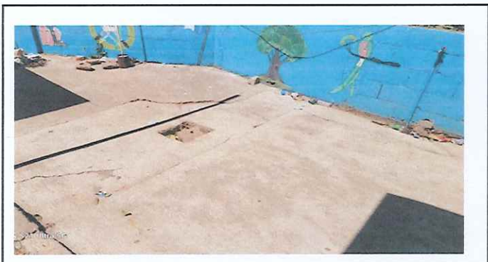
LOSA DE PATIO