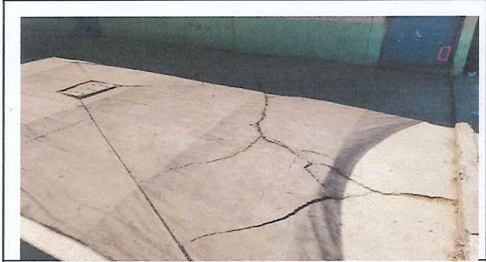
LOSA DE PATIO