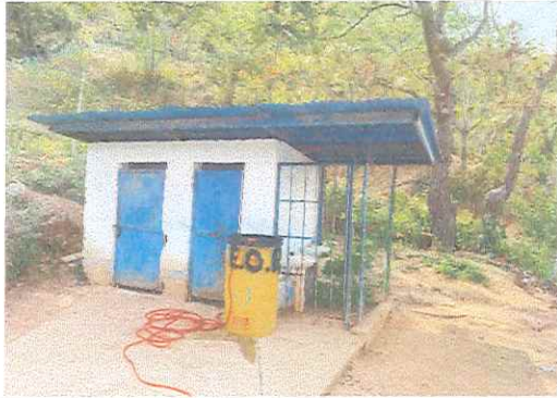
Foto 7: remozamiento de baños, mejoramiento de lavamanos, instalación de torta de concreto, pintura interior y exterior, remozamiento e instalación de puertas.