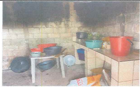
Foto 4: Ampliación de alto de pared de fondo para aislar el calor, instalación de piso cerámico, azulejo, cernido y pintura en cocina.