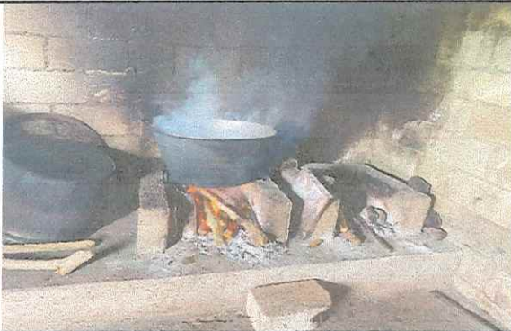
Foto 3: Suministro e instalación de estufa rural completa con chimenea y parrilla de metal.