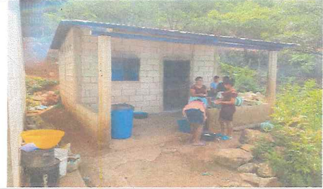
Foto 2: Ampliación y remodelación cocina, instalación de pila, torta de concreto, cernido de muros, lavatrastos, pintura, mejoramiento de ventana.