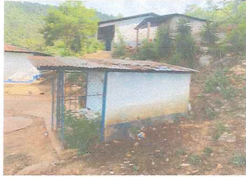
Foto 8: Ampliación de paredes para ampliación de módulo de baños, instalación de inodoros, puertas, piso de torta de concreto.