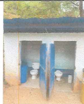
Foto 6: Remozamiento de baños con ampliación de muros, instalación de inodoros, azulejo, piso cerámico.

Observación: Si es necesario se pueden agregar hojas adicionales y actualizar el número de fotos.