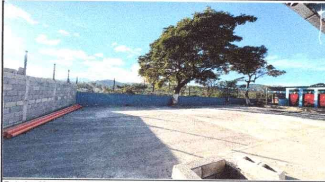
Foto1: Muro perimetral