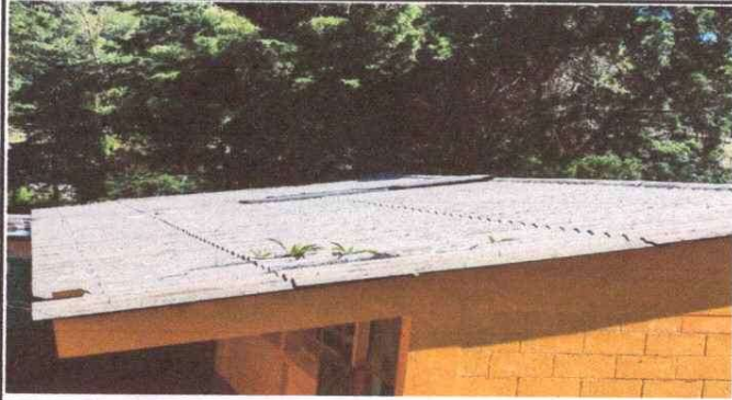
Foto1: Mejoramiento y colocacion de techado en aula, modulo 1