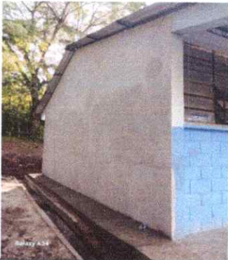
Foto 9: REPELLO Y CERNIDO EN PAREDES Y REPARACIÓN DE PISO DE TORTA DE CONCRETO