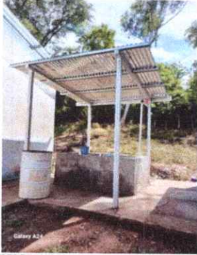
Foto 7: INSTALACIÓN DE TECHO Y MEJORAMIENTO EN PILA DE UN LAVADERO