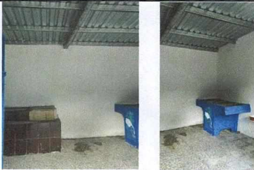
Foto 3: SUSTITUCIÓN DE TUBERIA PVC PARA AGUA POTABLE Y SUSTITUCIÓN DE PILA