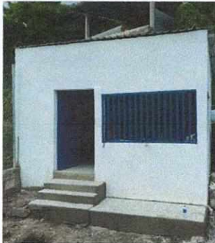
Foto 1: SUSTITUCIÓN TECHO, MEJORAMIENTO DE PAREDES, MEJORAMIENTO DE ESTUFA RURAL, SUSTITUCIÓN DE PISO DE CONCRETO, MEJORAMIENTO DE PUERTA Y ESTRUCTURA DE METAL DE VENTANA EN AREA DE COCINA