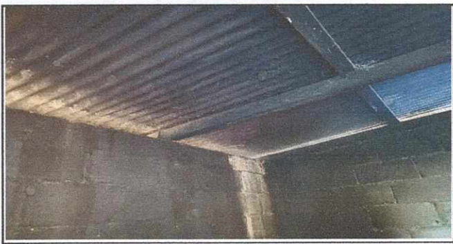
TECHO DE COCINA EN MALAS CONDICIONES SE NECESITA CAMBIO DE ESTRUCTURA Y LAMINA