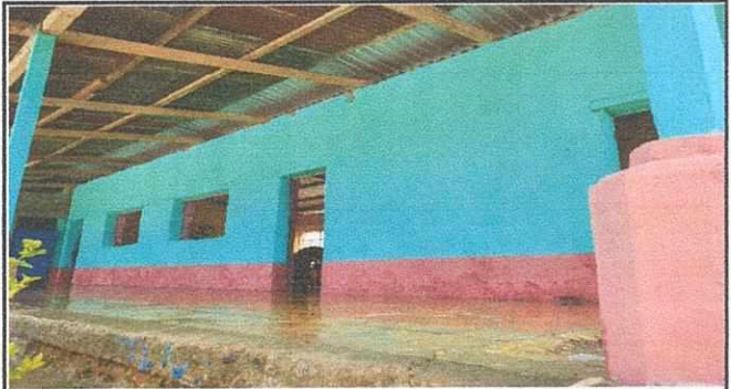
TECHO EN MAL ESTADO SE NECESITA CAMBIO