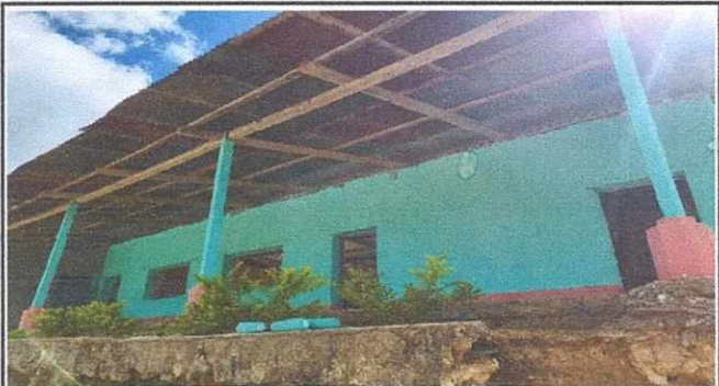
TECHO EN MAL ESTADO SE NECESITA CAMBIO