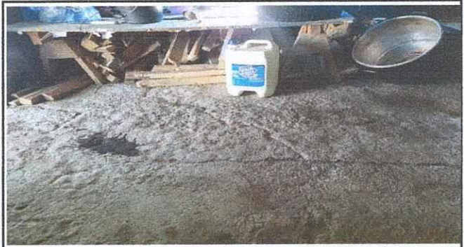
PISO DE COCINA CON FISURAS