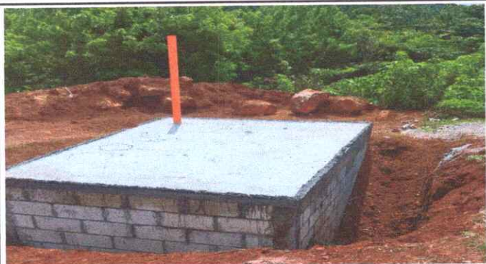
Mejoramiento de fosa septica.