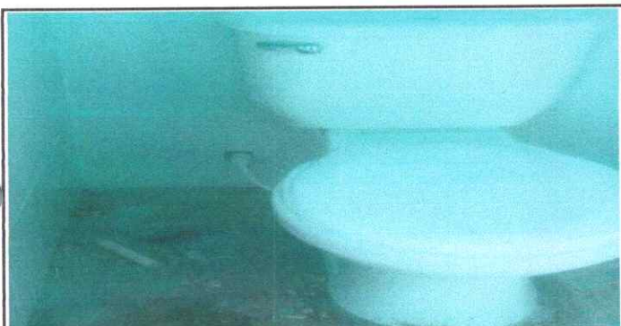
Levantado de baños e instalación de servicios sanitarios.