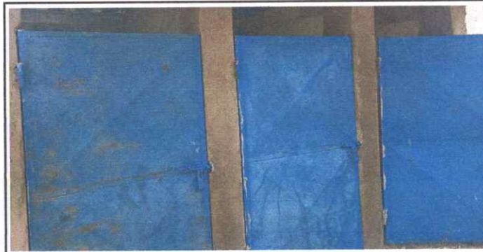
Mejoramiento de puerta de metal.