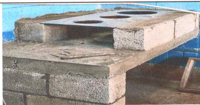
Mejoramiento de polletón.