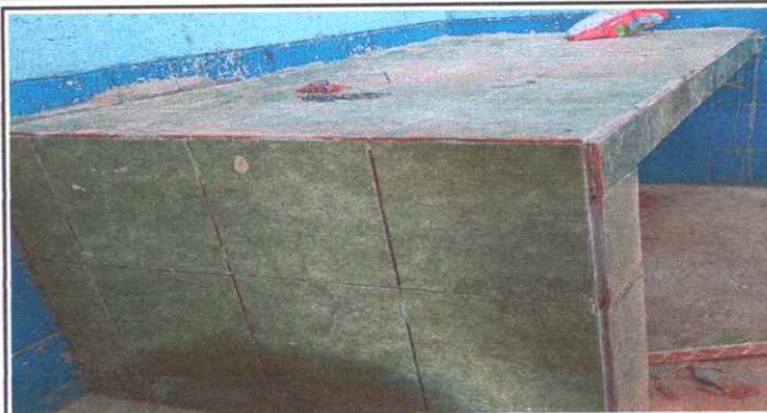
Mejoramiento de mueble de concreto.