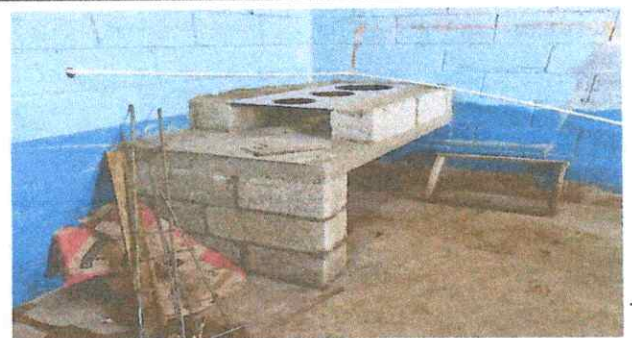
FOTO 6 Elaboración de polleton

Observación: Si es necesario se pueden agregar hojas adicionales y actualizar el número de hojas.