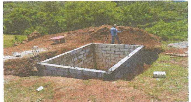
FOTO 4 Mejoramiento de fosa séptica