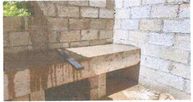
FOTO 2 Polleton de concreto con plancha