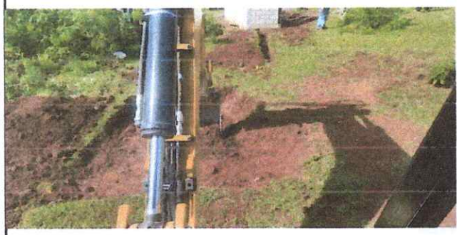
Foto1: perforación para fosa séptica