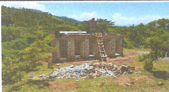
FOTO 5 Mejoramiento y cambio de baños sanitarios