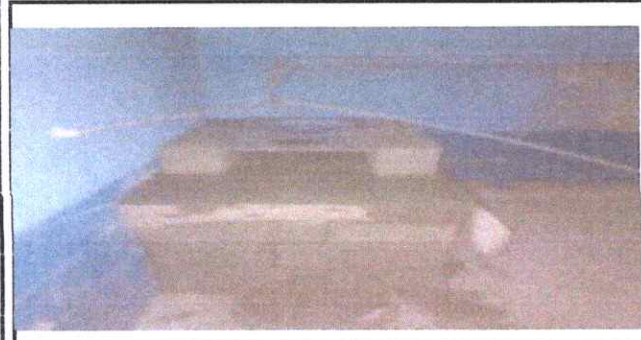
Foto: 5 estufa mejorada