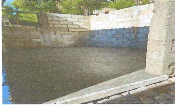
FOTO 1 Levantado de muro