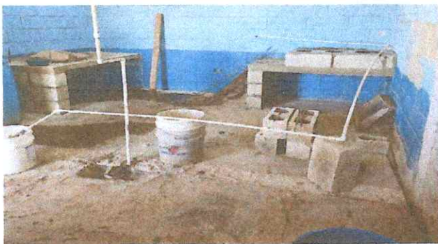
FOTO 3 Mejoramiento de mueble con azulejo