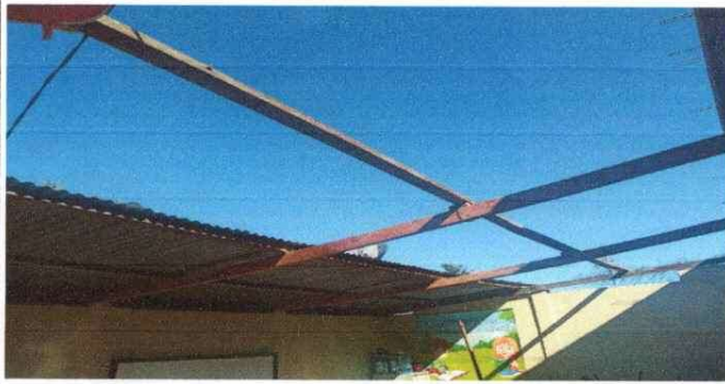
FOTO 1 SUSTITUCIÓN DE LÁMINA Y MADERA DE AULA 1