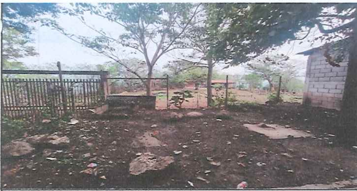
Foto 5: LIMPIEZA, LEVANTADO, FUNDICION, TALLADO, TECHO E INSTALACION TUBERIA Y PILAS EN AREA DE LAVADO