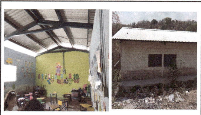
Foto 2: En la primera fotografía se ve el interior del aula No. 1 que se adecuará para laboratorio. La segunda fotografía muestra el exterior del aula No. 1, se reforzará con balcones de metal y se conformará otra