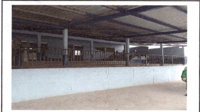
Foto1: Vista del interior del establecimiento educativo, al fondo se ubica el aula No 1 donde se ubicará el laboratorio de cómputo.