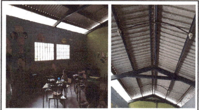
Foto 3: Vista interior del aula No. 1, se ven las ventanas que no ofrecen la suficiente iluminación y ventilación. En la segunda foto se ve el interior del techo que será reforzado con electromalla. Se ve el sistema eléctrico actual.