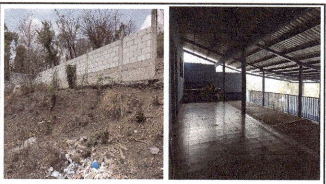
Foto 6: En la primera fotografía se ve otra sección del muro perimetral que será ampliado. En la segunda fotografía se ve al fondo el área donde se realizarán OTROS trabajos.