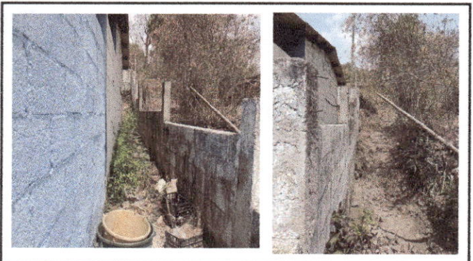
Foto 5: En las dos fotografías se ve parte del muro perimetral que será ampliado en su altura. En la primera foto se ve el interior y en la segunda se ve el exterior.