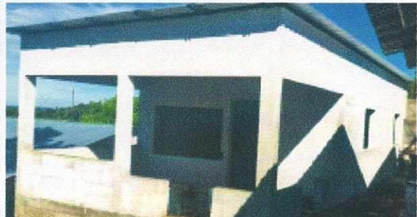
Foto 1: SUSTITUCIÓN TECHO, MEJORAMIENTO DE PAREDES, SUSTITUCIÓN DE ESTUFA RURAL, SUSTITUCIÓN DE PISO, INSTALACIÓN DE PUERTA E INSTALACIÓN DE ESTRUCTURA DE METAL DE VENTANA EN AREA DE COCINA