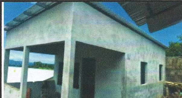
Foto 2: SUSTITUCIÓN TECHO, MEJORAMIENTO DE PAREDES, SUSTITUCIÓN DE ESTUFA RURAL, SUSTITUCIÓN DE PISO, INSTALACIÓN DE PUERTA E INSTALACIÓN DE ESTRUCTURA DE METAL DE VENTANA EN AREA DE COCINA