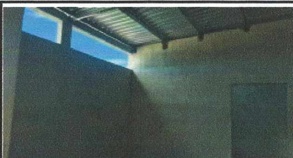
Foto 4: SUSTITUCIÓN TECHO, MEJORAMIENTO DE PAREDES, SUSTITUCIÓN DE ESTUFA RURAL, SUSTITUCIÓN DE PISO, INSTALACIÓN DE PUERTA E INSTALACIÓN DE ESTRUCTURA DE METAL DE VENTANA EN AREA DE COCINA