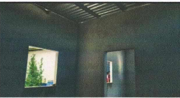
Foto 5: SUSTITUCIÓN TECHO, MEJORAMIENTO DE PAREDES, SUSTITUCIÓN DE ESTUFA RURAL, SUSTITUCIÓN DE PISO, INSTALACIÓN DE PUERTA E INSTALACIÓN DE ESTRUCTURA DE METAL DE VENTANA EN AREA DE COCINA