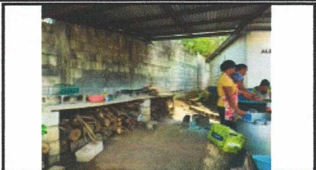
Foto 2: SUSTITUCIÓN TECTO, MEJORAMIENTO DE PAREDES, SUSTITUCIÓN DE ESTUFA RURAL, SUSTITUCIÓN DE PISO, INSTALACIÓN DE PUERTA E INSTALACIÓN DE ESTRUCTURA DE METAL DE VENTANA EN AREA DE COCINA