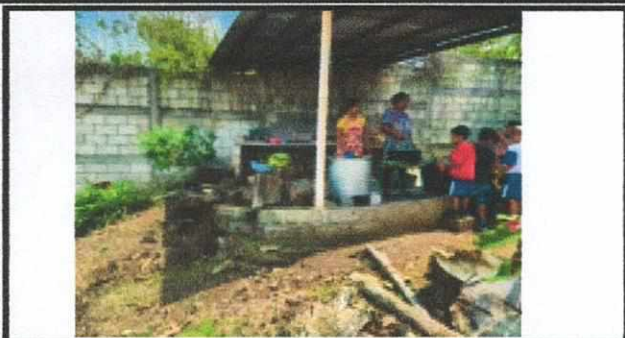
Foto 1: SUSTITUCIÓN TECTO, MEJORAMIENTO DE PAREDES, SUSTITUCIÓN DE ESTUFA RURAL, SUSTITUCIÓN DE PISO, INSTALACIÓN DE PUERTA E INSTALACIÓN DE ESTRUCTURA DE METAL DE VENTANA EN AREA DE COCINA