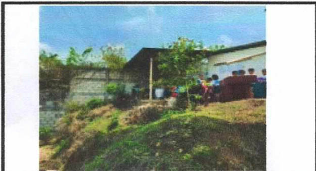
Foto 3: SUSTITUCIÓN TECTO, MEJORAMIENTO DE PAREDES, SUSTITUCIÓN DE ESTUFA RURAL, SUSTITUCIÓN DE PISO, INSTALACIÓN DE PUERTA E INSTALACIÓN DE ESTRUCTURA DE METAL DE VENTANA EN AREA DE COCINA