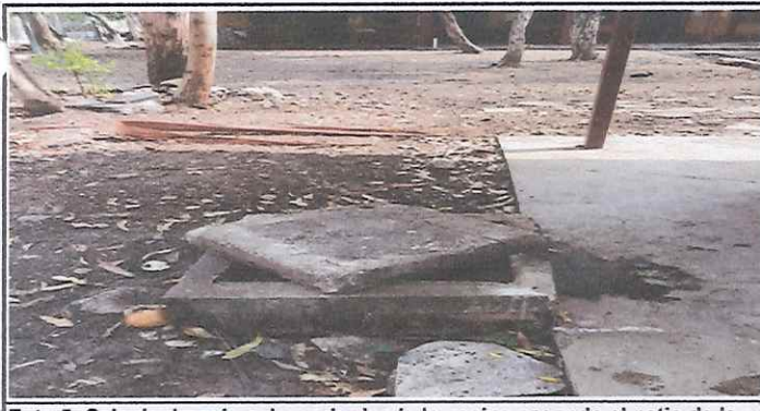
Foto 5: Caja de drenaje colapsado desde la cocina pasando el patio de la escuela