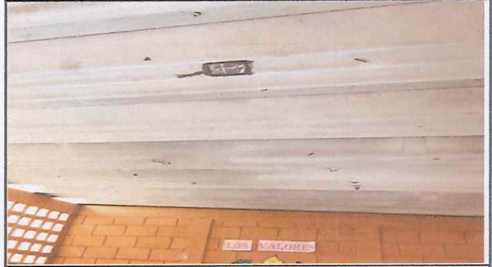
Foto 2: Techo de duralita con tapagoteras por agujeros con filtración de agua