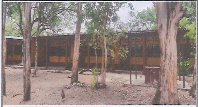
Foto 4: Fotografía panorámica de aulas a remozar por el techo de duralita