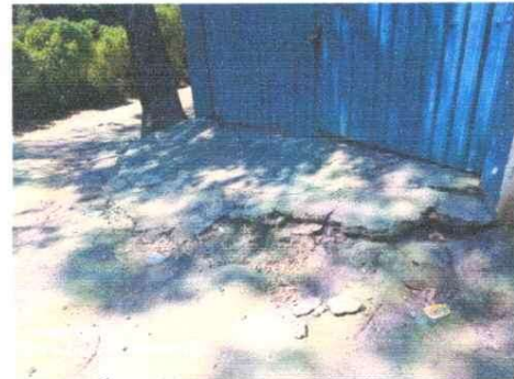
Foto.4 Rampa de ingreso al Establecimiento