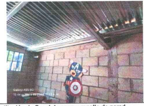
Foto. 6 Sustitución de Canal de agua y repello de pared

Observación: Si es necesario se pueden agregar hojas adicionales y actualizar el número de hojas.