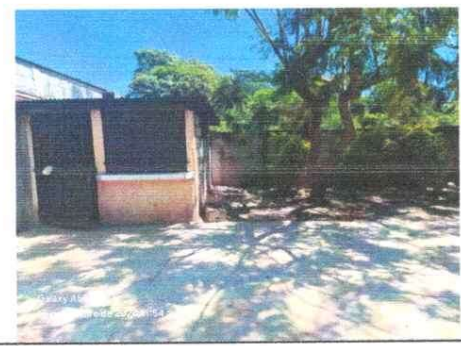
Foto.5 Ampliacion de Cocina