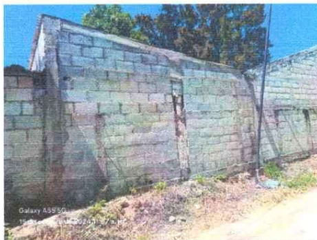
Foto: 3 Repello de pared de muro que es utilizada en aula.