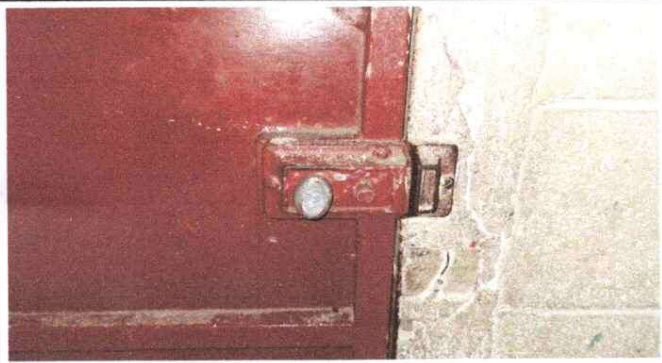
CHAPAS DE PUERTAS INSERVIBLES