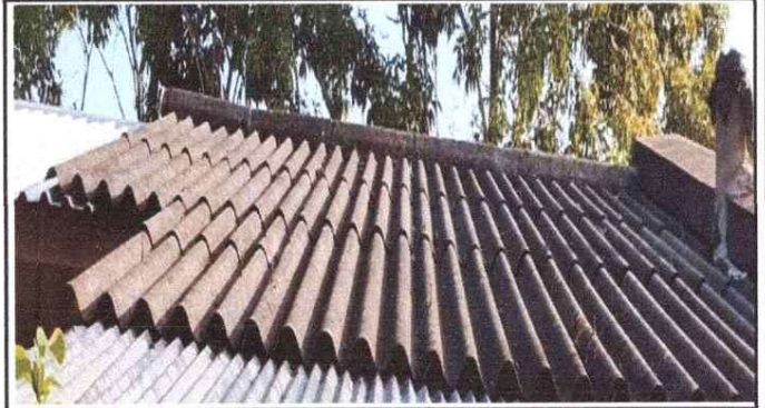
CAMBIO DE DURALITA EN MAL ESTADO