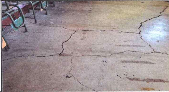
TORTA EN MAL ESTADO