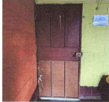
MANTENIMIENTO A PUERTAS