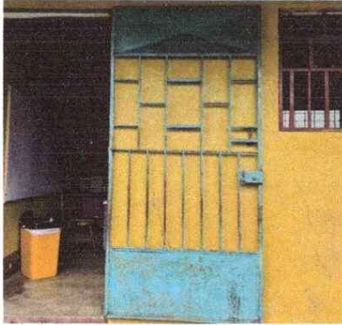
PUERTA EN MAL ESTADO