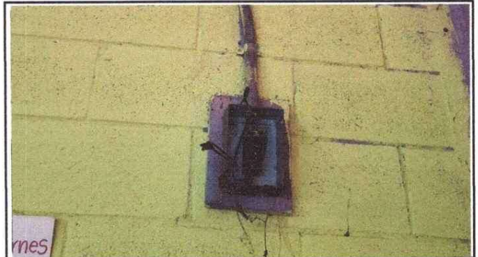
SISTEMA ELÉCTRICO EN MAL ESTADO