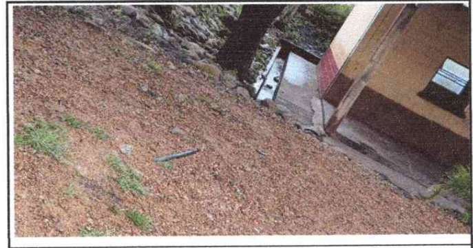
CABLES ELÉCTRICOS EN MAL ESTADO

Observación: Si es necesario se pueden agregar hojas adicionales y actualizar el número de hojas.