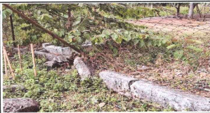
MURO PERIMETRAL EN MAL ESTADO