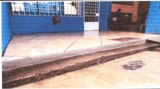
Foto 3: REMOZAMIENTO DE PISO CERAMICO EN EL INGRESO AL SALÓN PRINCIPAL EVITANDO EL HUNDIMIENTO Y RESGUARDANDO QUE INGRESAN PARA EVITAR UN ACCIDENTE