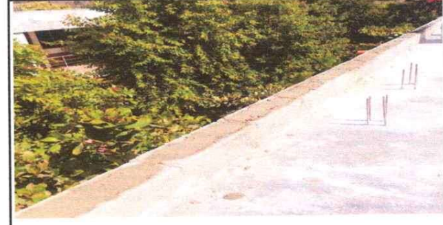
Foto 6: LEVANTAMIENTO DE BORDILLO DE BLOCK REDIRIGIR EL AGUA PLUVIAL HACIA LAS GARGOLAS Y QUE ESTA NO DESCENDA POR LA PAREDES

Observación: Si es necesario se pueden agregar hojas adicionales y actualizar el número de hojas.