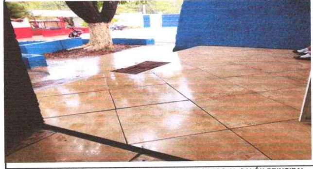
Foto 4: REMOZAMIENTO DE PISO CERAMICO EN EL INGRESO AL SALÓN PRINCIPAL EVITANDO EL HUNDIMIENTO Y RESGUARDANDO QUE INGRESAN PARA EVITAR UN ACCIDENTE