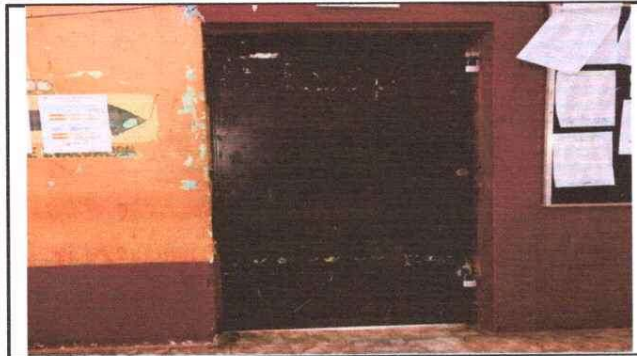
Foto 1: REFORZAMIENTO DE PUERTA CON PASADOR PARA RESGUARDO DE BIENES Y DOCUMENTOS