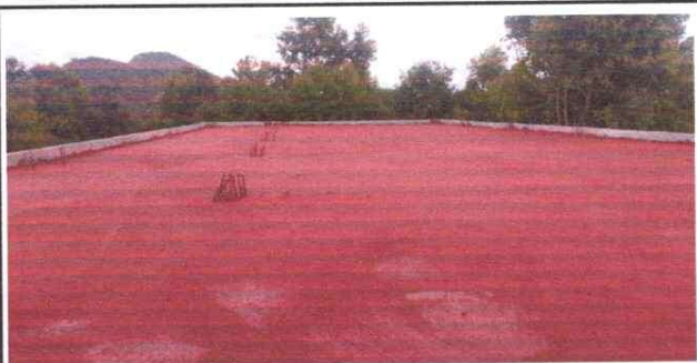
Foto 5: REMOZAMIENTO DE TECHO TIPO LOZA EDIFICIO EVITAR LA HUMEDAD Y EL INGRESO PLUVIAL A LAS AULAS