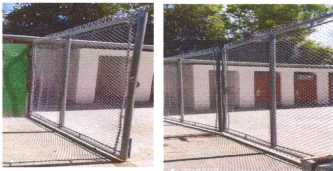
Foto 5: MANTENIMIENTO APORTONES: Sustitucion de malla y tubo quebrado