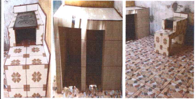
Foto 8: REPARACION O SUSTITUCION DEL AREA DE COCINA. ( Estufas rurales, pilas, ventanas, puertas, chimeneas etc) Reparacion de las planchas, sustitucion del piso y ventanas