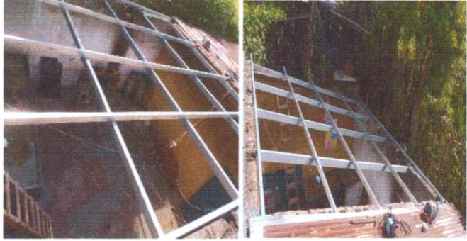
Foto1: SUSTITUCION DE CUBIERTA DE LAMINA: en toda la cocina debido a que esta en mal estado.