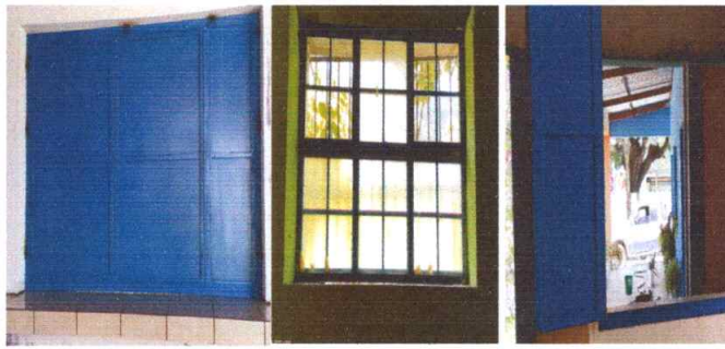
Foto 3: VENTANAS: Sustitucion de ventanas en la cocina y las aulas