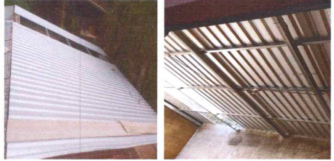
Foto 2: ESTRUCTURA DE TECHO: sustitucion de la misma en la cocina y los baños debido a que estan en malas condiciones