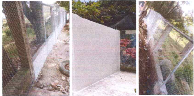
Foto 6: CERCO O MURO PERIMETRAL: Reparacion de muro perimetral de la escuela

Observación: Si es necesario se pueden agregar hojas adicionales y actualizar el número de hojas.