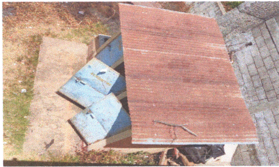
Foto1: SANITARIOS EN MAL ESTADO