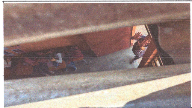
Foto4: LAMINA EN MAL ESTADO