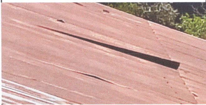
Foto3: LAMINA EN MAL ESTADO