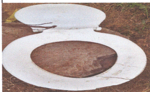
Foto: 5 SANITARIOS