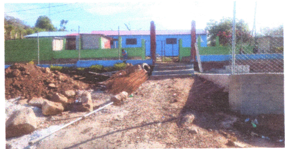
Foto4: Sustitución de Losa de Patio pues se encuentra casi en su totalidad deteriorada