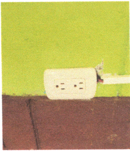
Foto1: Reparación de cableado eléctrico y cambio de tomacorrientes