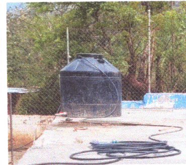
Foto: 6 Reparación de tubera de Deposito de Agua

Observación: Si es necesario se pueden agregar hojas adicionales y actualizar el número de hojas.