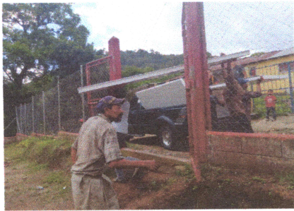
Foto: Mantenimiento del porton principal por deterioro casi completo