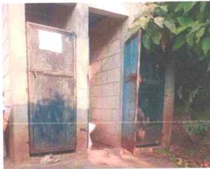
Foto: 5 Reparación y mantenimiento a sanitarios