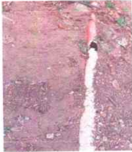
Foto7: Reparación de drenajes y red de agua potable