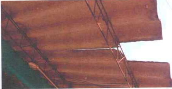
Foto1: Sustrucción de lamina por deterioro