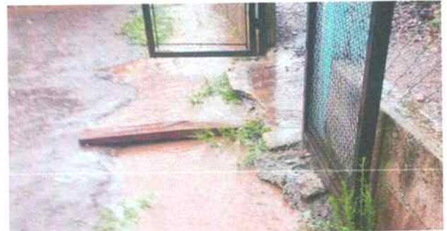
Foto: 6 Reparación y mantenimiento de portón

Observación: Si es necesario se pueden agregar hojas adicionales y actualizar el número de hojas.