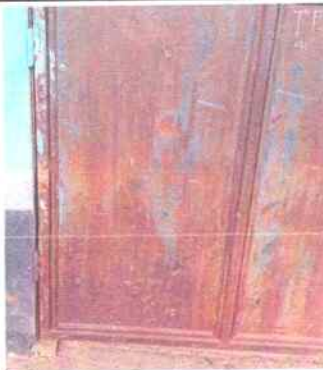
Foto3: Mantenimiento de puertas