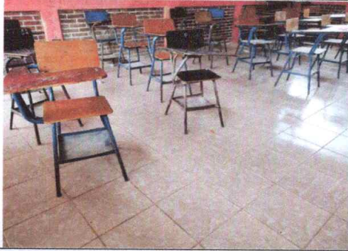
Foto1: colocacion de ceramica finalizado