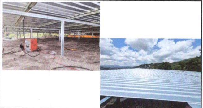
Foto 4: colocacion de lamina y estructura en Terraza dañada finalizado