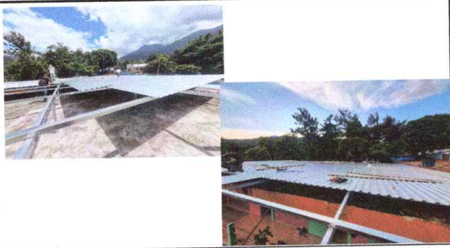
Foto 3: En proceso colocación de lamina y estructura en Terraza dañada