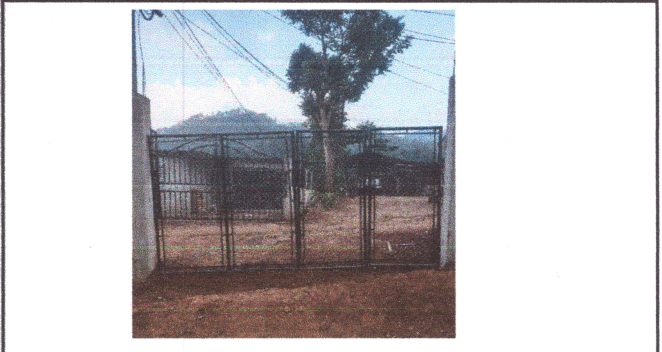
Foto4: Sustitución de portón