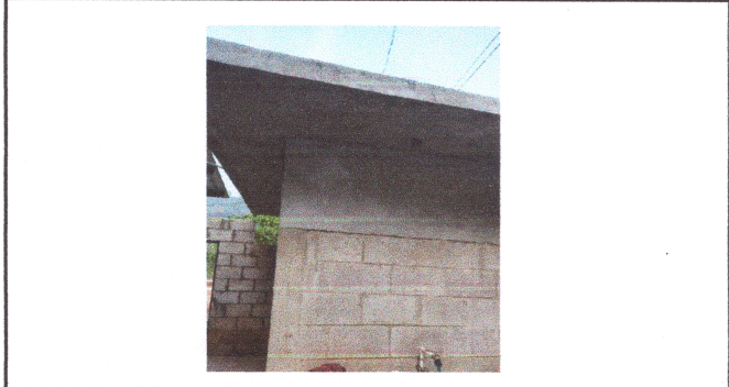
Foto1: Reposición de losa