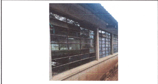
Foto3: Reposición de ventanas