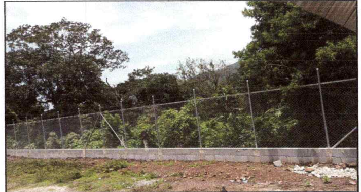
Foto 4: CERCO O MURO PERIMETRAL se observa muro perimetral finalizado