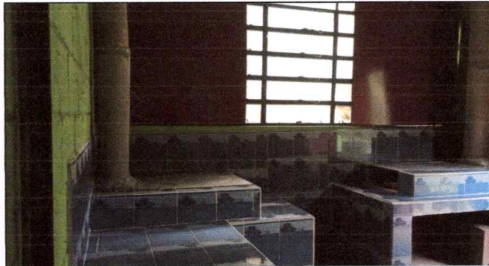
Foto 3: REPARACIÓN O SUSTITUCIÓN DE ÁREA DE COCINA trabajo finalizado en su totalidad