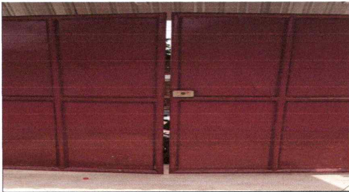
Foto1: MANTENIMIENTO A PORTONES trabajo terminado en portones