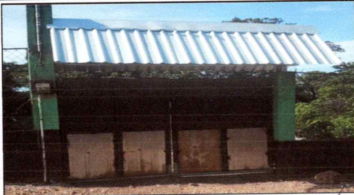
Foto1: MANTENIMIENTO A PORTONES se observa trabajo en proceso a portones trabajado un 50%