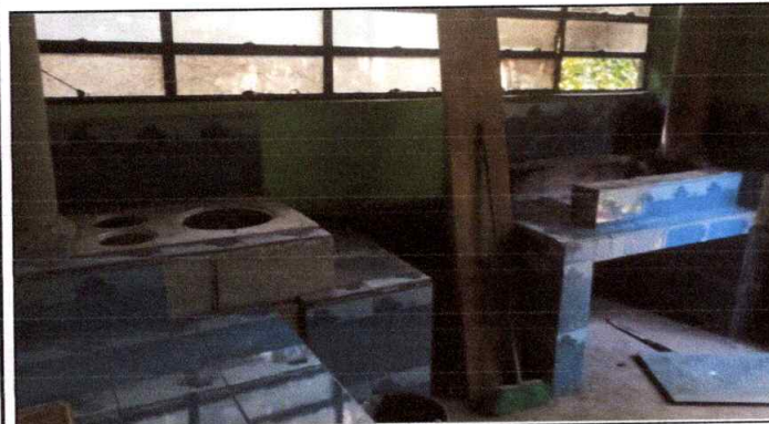
Foto 3: REPARACIÓN O SUSTITUCIÓN DE ÁREA DE COCINA se observa trabajo en proceso en un porcentaje de 70%