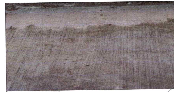
Foto 6: LOSA DE PATIO trabajo en proceso en un porcentaje del 60%

Observación: Si es necesario se pueden agregar hojas adicionales y actualizar el número de hojas.