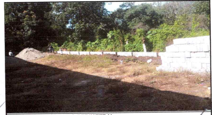
Foto 4: CERCO O MURO PERIMETRAL Reparación de muro en proceso en un porcentaje de 60%