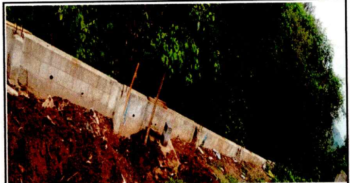
Foto 4: CERCO O MURO PERIMETRAL Se evidencia muro perimetral no terminado