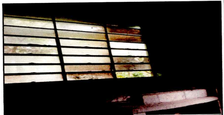
Foto 6: REPARACIÓN O SUSTITUCIÓN DE ÁREA DE COCINA Se observa mal estado de plancha y polleton su alrededor y ventanas

Observación: Si es necesario se pueden agregar hojas adicionales y actualizar el número de hojas.