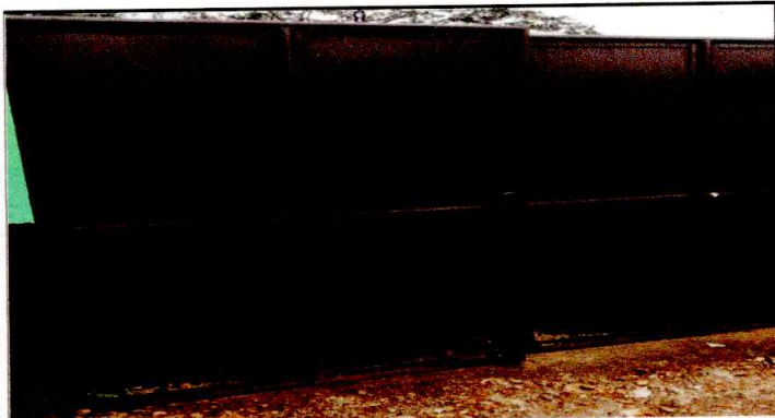
Foto 3: MANTENIMIENTO A PORTONES Deterioro de parte baja de portón