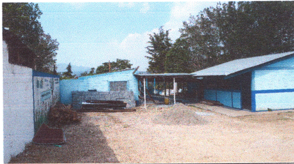
Foto3: Reparación Estructura de Techo