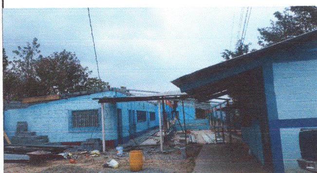
Foto: 6 Reparación de Sistema eléctrico

Observación: Si es necesario se pueden agregar hojas adicionales y actualizar el número de hojas.