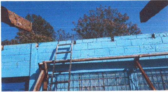
Foto1: Reparación estructura de techo