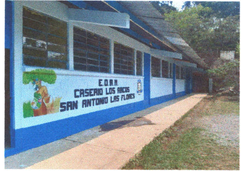
FOTO 2: Culminación de aplicación de pintura en interiores y exteriores del centro educativo.