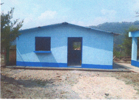
Foto1: Culminación de ampliación de cocina, instalación de estructura de metal, cubierta de lámina, sustitución de torta por piso de granito, reemplazo de estufas rurales, instalación y sustitución de puertas y ventanas.