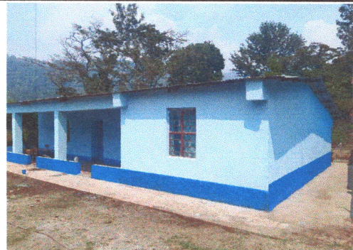
Foto: 6 Culminación de fundición de losa de patio en alrededor de aulas.

Observación: Si es necesario se pueden agregar hojas adicionales y actualizar el número de hojas.