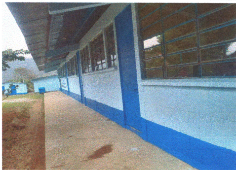
Foto: 5 Culminación de aplicación de pintura en interiores y exteriores del centro educativo.