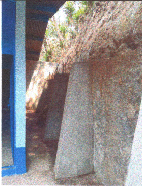
Foto3: Culminación de fundición de bases de soporte para muro de contención.