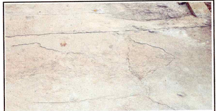
Foto4: Se observa bajadas de agua en mal estado.