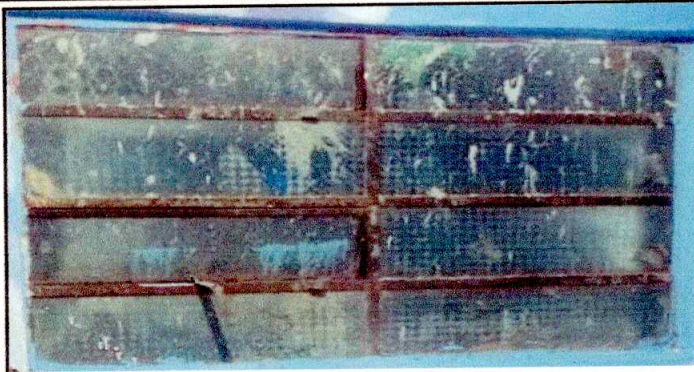
Foto1: Se observan ventanas en mal estado.