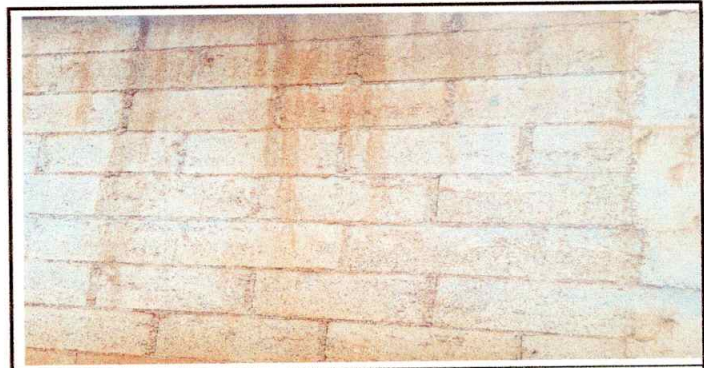
Foto: 6 Se evidencia pintura de paredes deteriorada.

Observación: Si es necesario se pueden agregar hojas adicionales y actualizar el número de hojas.