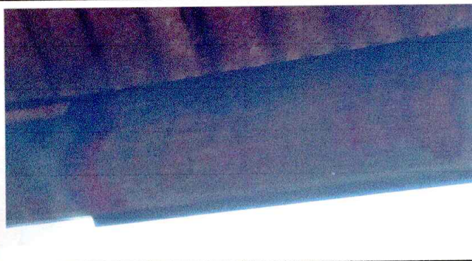
Foto3: Se observa canal en mal estado.