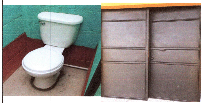
FOTO 7: Sustitución de servicios sanitarios. FOTO 8: Sustitución y mantenimiento de portones.