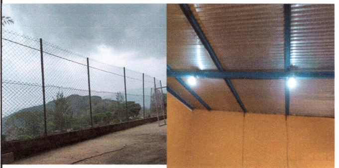
FOTO 9: Cerco perimetral. FOTO 10: Reparación de sistema eléctrico.