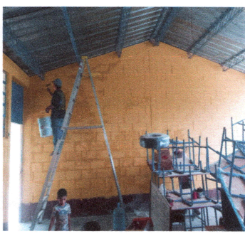
Foto 5: Sustitución de piso. FOTO 6: Pintura interior y exterior.