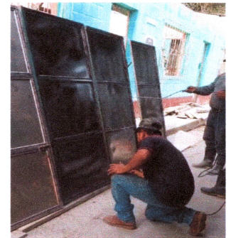
Foto 7: Sustitución de servicios sanitarios. FOTO 8: Sustitución y mantenimiento de portones.