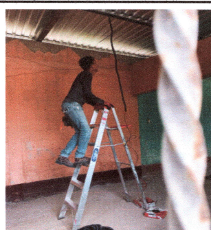
Foto 9: Cerco perimetral. FOTO 10: Reparación de sistema eléctrico.