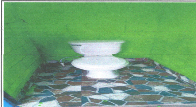
Foto3: INSTALACIONES BAÑOS NUEVOS