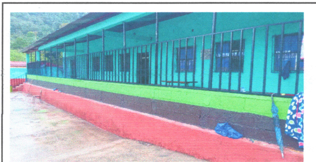
Foto: 5 PINTURA INTERIOR Y FUNDICION DE PASAMANO CON REPARACION DE BARANDALES