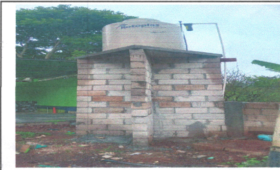
Foto4: INSTALACION DE TINACO CON BASE