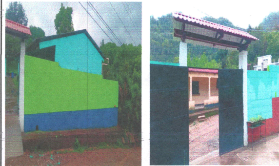
FOTO 2: PINTURA DE MURO EXTERIOR, REPARACION DEL PORTON DE ENTRADA Y RAMPA.