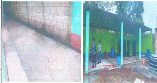
Foto1: IMPERMEABILIZACIÓN DE LOSA Y LOSA DEL PATIO