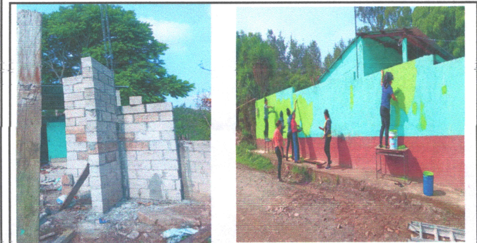
Foto3: CONSTRUCCION DE BASE DE TINACO Y PINTADO DE MURO EXTERIOR