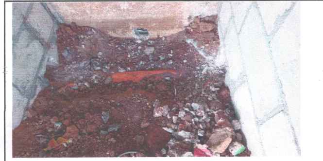
Foto: INSTALACION DE DRENAJES Y TUBERIA DE ENTRADA DE AGUA

Observación: Si es necesario se pueden agregar hojas adicionales y numerar el número de hojas.