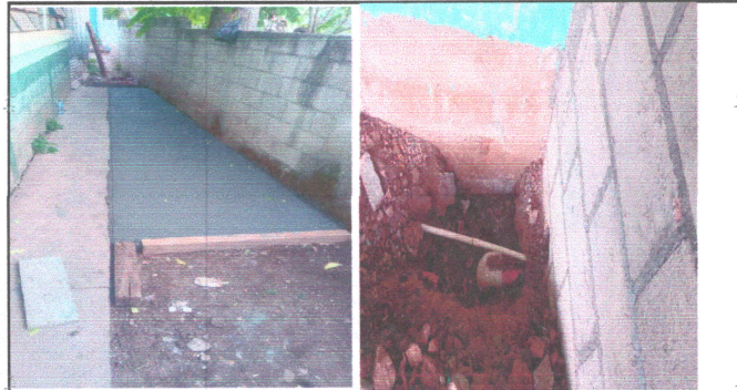
Foto4: INSTALACION DE LOSA DE CONCRETO EN LA PARTE TRASERA DE LA ESCUELA Y TUBERIA DE DRENAJES DE BAÑOS