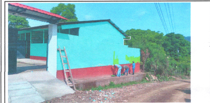
Foto: 5 PINTADO DE MURO EXTERIOR Y FUNDICION DE RAMPA DE ENTRADA DE LA ESCUELA Y REPARACION DE PORTON