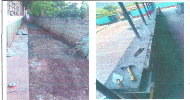
FOTO 2: INSTALACION DE LOSA DE CONCRETO Y FUNDICION DE PASAMANO CON REPARACION DE BARANDAL