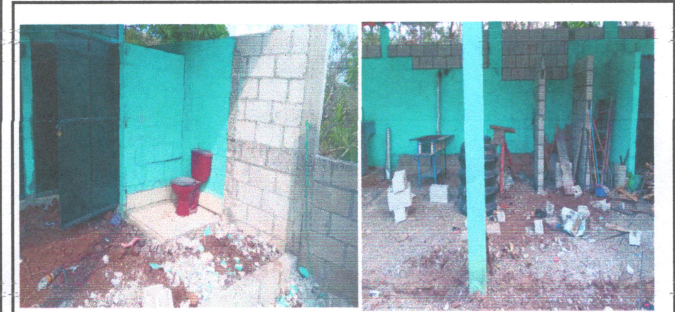
Foto1:REPARACION DE PAREDES E INSTALACION DE BAÑOS NUEVOS Y LOSA DE CONCRETO