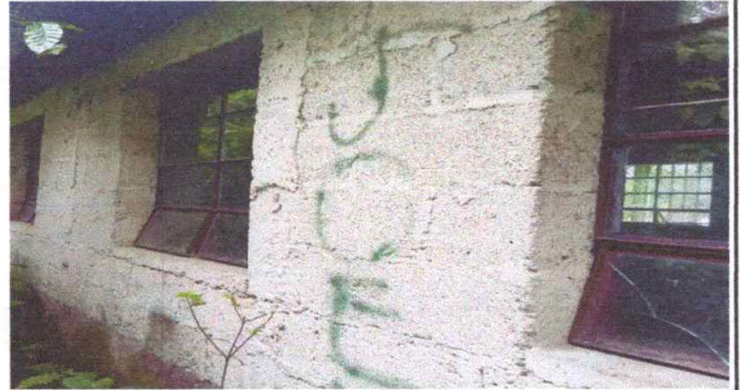
Reparación de ventanas