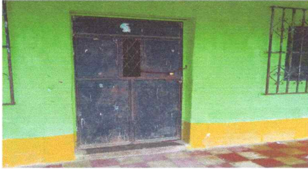
Reparación de puertas