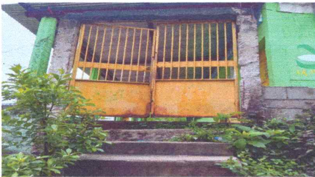
Mantenimiento y reparación de portón