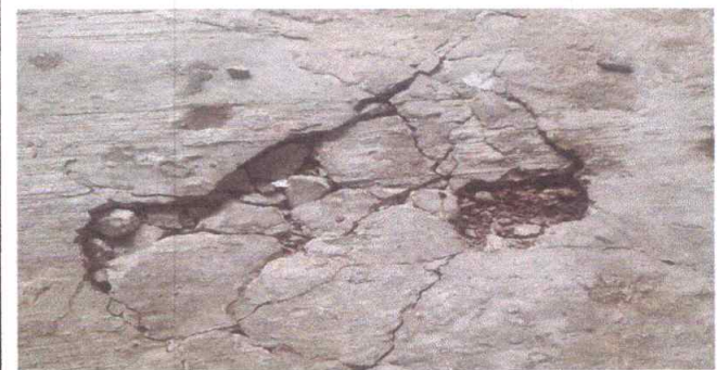
Reparación de loza de patio

Observación: Si es necesario se pueden agregar hojas adicionales y actualizar el número de hojas.