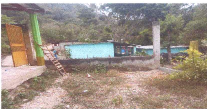
Reparación de muro perimetral