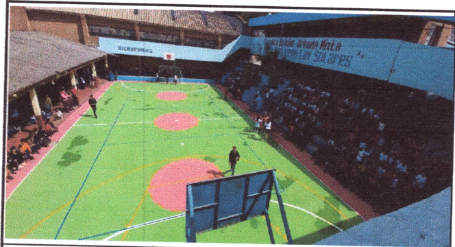
Foto4: PINTURA DE MUROS, EXTERIORES, INTERIORES, FACHADAS, PASILLOS, GRADAS, PUERTAS Y PORTONES.