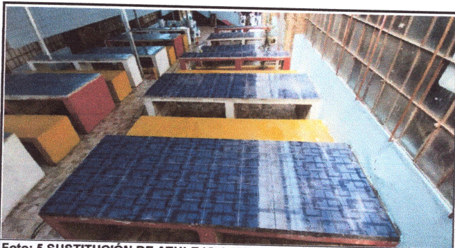
Foto: 5 SUSTITUCIÓN DE AZULEJO A MESAS DEL AREA DE COMEDOR Y COCINA.