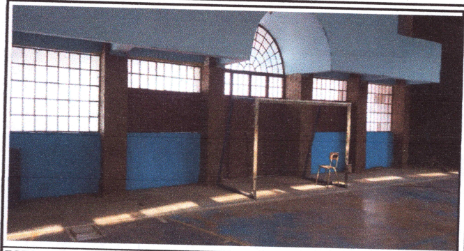
FOTO 2: SUSTITUCION DE VIDRIOS ROTOS EN VENTANALES DE AULAS Y AUDITORIUM DE LA ESCUELA.