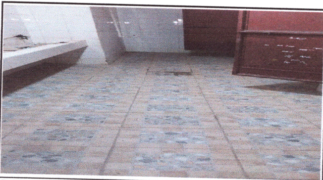
Foto3: SUSTITUCIÓN DE PISO MODULO DE SANITARIOS DE NIÑOS, DE NIÑAS, VESTIDORES Y PASILLO DE PILAS.