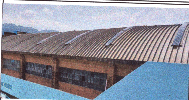
Foto1: SUSTITUCION DE CUBIERTA DE LAMINA TRAGALUZ DEL TECHO DEL AUDITORIUM DE LA ESCUELA