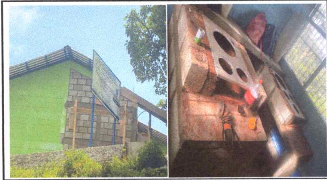
Foto1: se observan paredes y área de cocina en remozamiento.