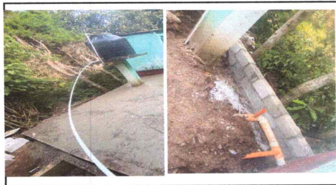
Foto 4: Se observa el trabajo de compostura para el deposito de agua .