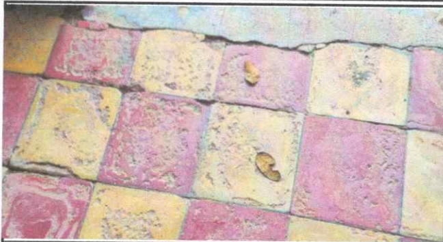
Foto1: SUSTITUCION DE PISO