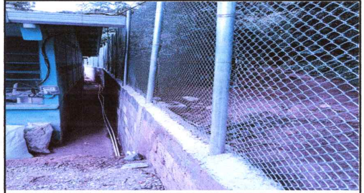
Foto 2: Sustitución de Cerco o Muro Perimetral (sustitución con Block y malla)