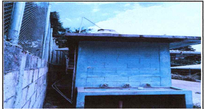
Foto 4: Reparación y Mantenimiento de Cisterna (depósito de agua)