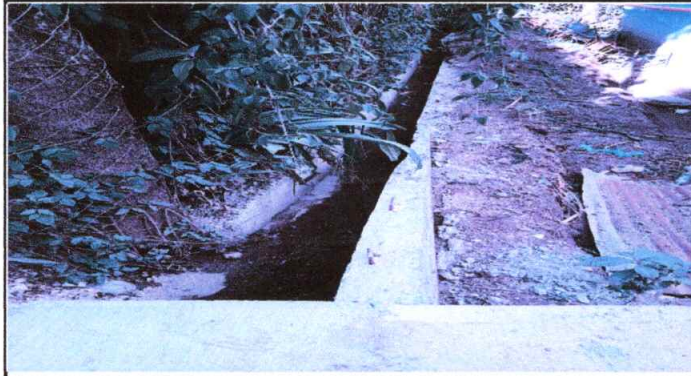
Foto 1: Reparación y sustitución de cuneta de concreto (sustitución y fundición)