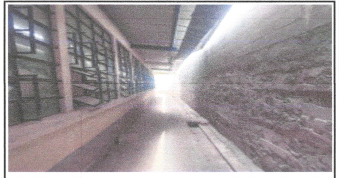
Foto4: Reparacion de Canales y bajadas de agua pluvial