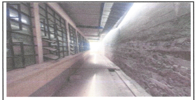
Foto: 6 Reparacion de Canales y bajadas de agua pluvial

Observación: Si es necesario se pueden agregar hojas adicionales y actualizar el número de hojas.