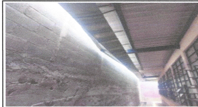
Foto3: Reparacion de Canales y bajadas de agua pluvial