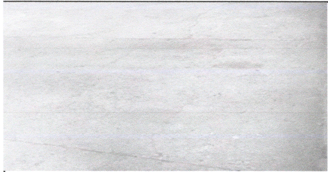
Foto1: Reparacion de losa en mal estado